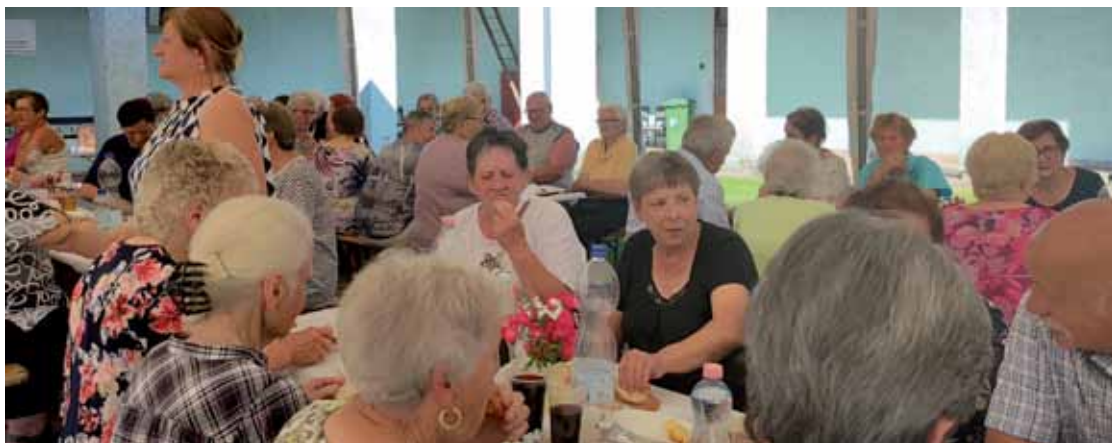
Pod šatorom, steroga je postavila dolenjesenička samouprava, so se penzionisti fajn meli.

Program so začnili člani glasbene skupine Neman časa DU Rogašovci, moški so najprva spopejvali dvej pesmi, stere so trno lepau donele večglasno v dvorani. Za njimi smo leko poglednili članice Sekcije skečev DU Šalovci, stere so zašpilale skeč Na carini. Štorija je pripovedjala o tom,