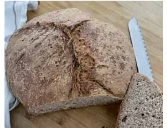
Krúj, naš vsakdanešnji, je prva stvar, ka so jo vözračunali. Leta 1991 je za kilo krúja trbelo 31 minuti delati. Gnesden se za kilo krúja »samo« 27 minutov dela.

... se je na velke 35 lejt suverene Slovenije sveto. Tau je biu rojstni den, kakšnoga niške ne paumni. V Ljubljani se je na velkom mitingi leko eške gnauk vidlo, kak je Slovenija politično raztalana. Eške gnauk se je tista stara zblojena istina