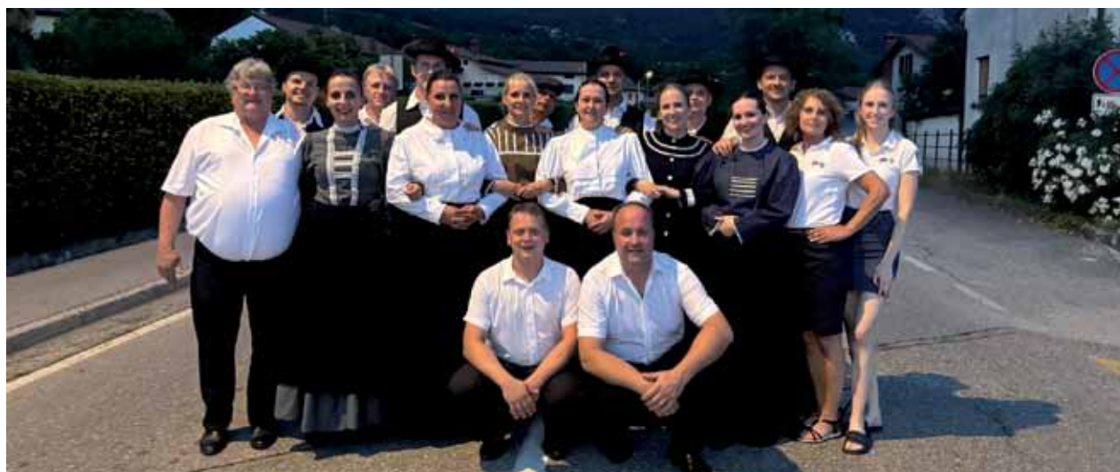
Skupinska fotografija sakalovskih folkloristov in muzikantov.

si ogledali svetovno znano in čudovito Tolminsko korito. Naravni čudež Triglavskega narodnega parka, ki predstavlja tudi njegovo najnižjo točko, je prekrasen v vseh letnih časih in s svojo lepoto očara prav vsakogar. Krožna pot skozi divja korita Tolminke in Zadlaščice, ki se združita v edino sotočje v koritih na ozemlju Slovenije, je v vročih poletnih dneh ponudila prijetno osvežitev. Po skupnem ogledu jih je čakala še dolga pot nazaj v Porabje. Na poti so se, kot pravi Slovenci, ustavili še v Trojanah, kjer so si privoščili kosilo. Domov se je skupina vrnila utrujena, vendar pol-