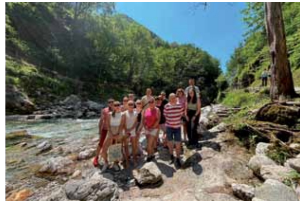
Nastop smo povezali tudi z izletom.

Nekaj energije so prihranili tudi za nedeljo, ko so