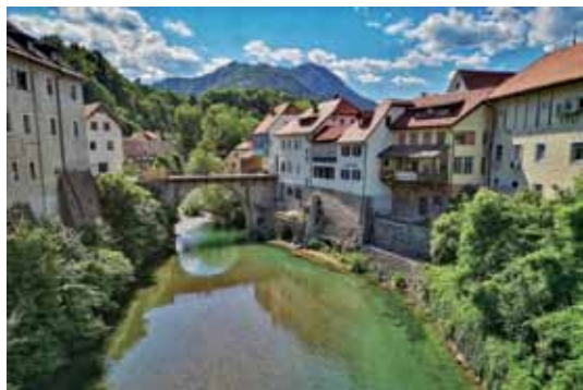
Maust prejk reke Sore oba brgauva je »vküper zvezo«. Od njega vnauge pripovejsti živejo. Depa mi najprva v pripovejsti od varaša Škofja Loka nut poglednimo.

V časi brezi dugi poštij so po njej čunaklini lidi pa blago vozili. Ranč tak so čunaklini z enoga na drugi brejg lidi, pauv pa vse dugo prejk pelali. Dokejš si je nej človek maust vözbrodo. Najprva so je iz lesa delali. Takše mauste je voda dostakrat odnesla ali pa ji je v zimi led vküper spotro. Iz velki kamlov so začnili vse višise mauste delati, sterim sta led