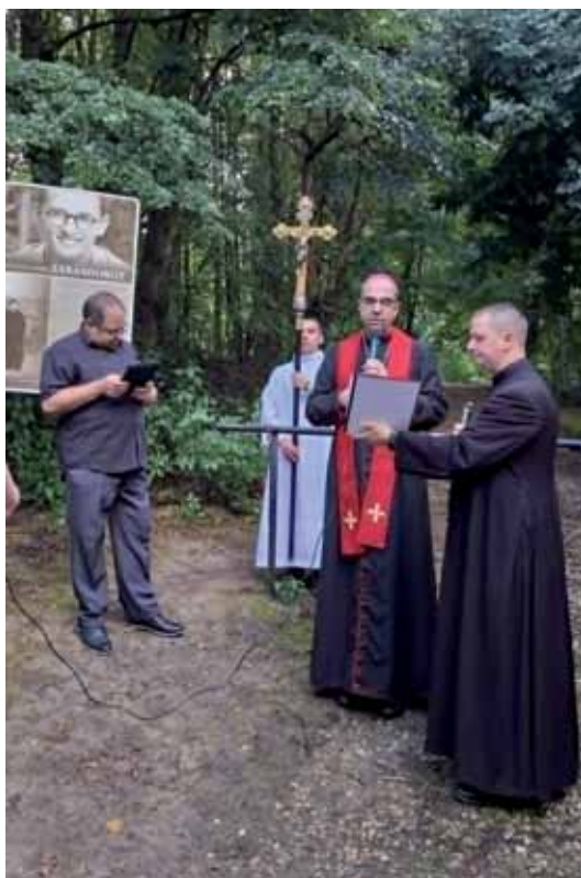
Blagoslovitev romarske poti Luč ob meji