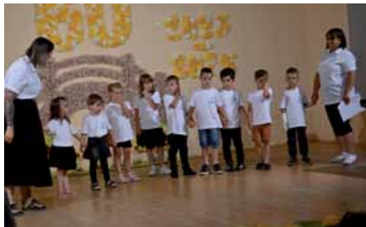
Malčki so predstavili lep slavnostni program.

Vrtec na Gornjem Seniku je svoja vrata odprl v šolskem letu 1965/66. Potreba po njegovem delovanju se je pojavila v začetku šestdesetih let prejšnjega stoletja, ko je vse več staršev našlo zaposlitev v tovarnah in obratih v Monoštru. Vrtec je bil urejen v nekdanji skladiščni stavbi Áfész.