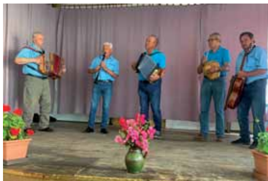
V kulturnom programi so gorstaupili muzikantje skupine Neman časa.

D rštvo porabski slovenski penzionistov je melo letošnji piknik s kulturnim programom v petek 19. junija na Dolenjom Seniki, gde se je zbralo kakšni 60 penzionistov pa 25 nastopajočih in gostov. Med gosti smo leko