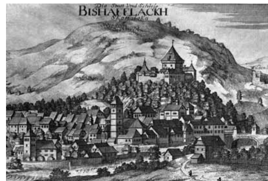
Kejs Škofje Loke iz leta 1679, spodkar na pravom kraji kamniti maust se leko vidi. Kamniti most je prvo ménje, ka ga je maust emo. Mi bi njemi kameni maust prajli. Zakoga volo so ga tak zvali? Samo zatoga volo, ka v tistom časi so mausti zvekšoga eške iz lesa bili napravleni.

klauster pa svojo cerkev zozidajo. Ranč na tistom mesti si vse tau naredijo, do steroga poštija prejk mausta v varaš pride. Kamniti most ménje kapucinski most dobi. Bratovge kapucini eške gnesden v Škofji Loki živijo pa delajo. Leta 1803 pa püšpe-