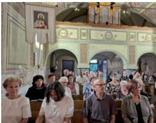
Verniki so prišli k maši z obeh strani meje.

Slovesnost je potekala v okviru čezmejnega projekta Messages, ki je sofinanciran iz programa Interreg Slovenija-Madžarska. Projekt je usmerjen v ohranjanje in predstavitev duhovne, kulturne ter zgodovinske dediščine