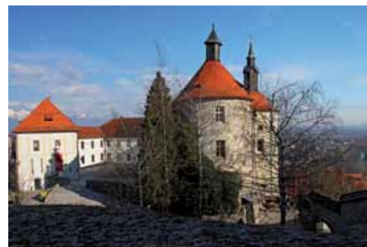
Gnako se z gradom zgodi. Tüdi Loški grad po leti 1803 več ne smeje v rokaj püšpekov ostanoti. Po tom leti se v njem vnaugi verti vöminijo, gnes v njem Loški muzej živi pa dela.

Ka pa se je v tom časi z maustom godilo? Pomalek je čas biu, ka na nauvo ga »vözavnajo«. S tejm se eške gnauk njegvo ménje vömini. Leta 1888 ga vrkar bole šurkoga naredijo. Nej samo tau, maust eške železno grajko dobi. Vse tau se v tom časi godi, gda cesar Ferenc Joška že 40 lejt na trauni Monarhije sedi. Zato-