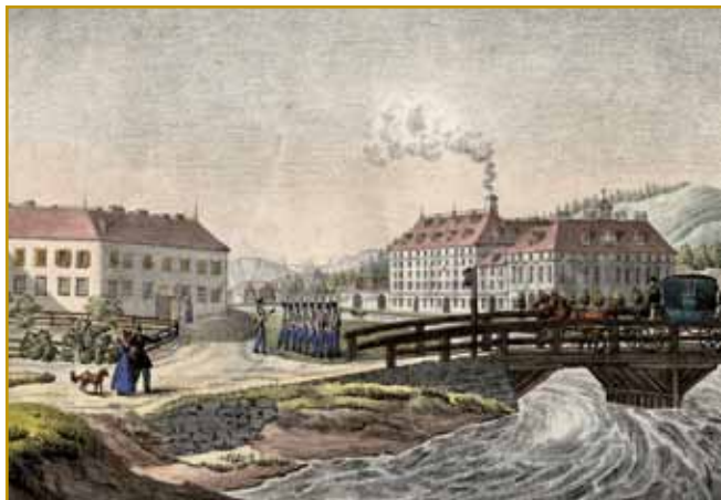
Tau zagnauk za najbolje poznani kejp Cukrarne vala. Od rejsan velke fabrike pripovejdamo, v steroy se je dosta vsega oprvin zgodilo. Vse tau je industrijska revolucija naprej prinesla.

Ménje Cukrarna si leko kak bauto s cukrami tumačimo. V Ljubljani pa vsikšji vej, ka je