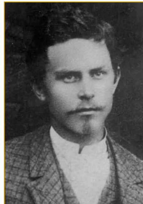
Dragotin Kette je zvekšoga pesmi piso. V vnaugi novinaj ji je vöda, depa za življenja je ena njegva knjiga nej vöprišla. V Cukrarni je kak srmak mrau, kuman 23 lejt star je biu. Za enoga od fundamentov slovenske moderne vala.

Cukrarna pa eške gnesden stodji. Zaprav, čas go je skur na nikoj djau. Za velko sramoto Ljubljane je valala. Dugo se je nej vedlo, ka aj z njau naredijo. Kak zibeu slovenske moderne za blago je valala. Nauvi časi so Cukrarni nauvo življenje dali. Gnes za moderen kulturni center