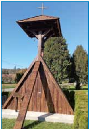
ŠVERCERI, ŠPIJONI ... stran 4