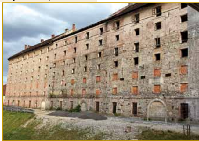
Sramota Ljubljane je nekaj lejt nazaj tak vögladala.

Cukrarna je dugo za najveško fabriko na Slovenskom valala. Ranč tak je tam prvi mašin paro začno delati, nindri indri na Slovenskom so ga eške nej meli.