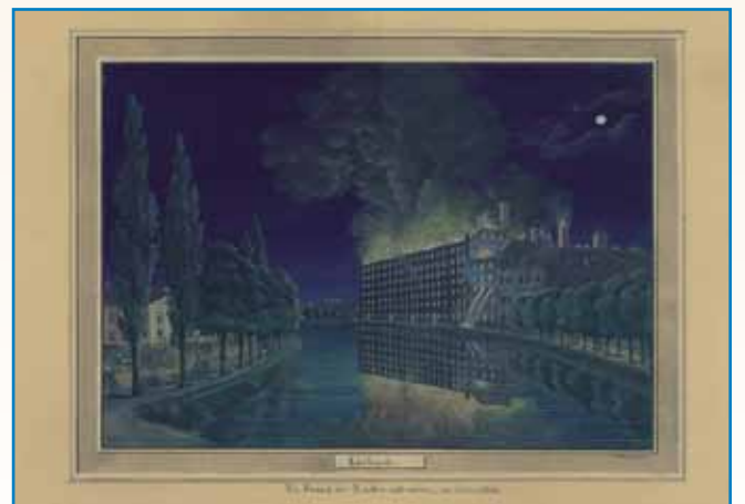
ZIDINE PRIPOVEJDAJO stran 9