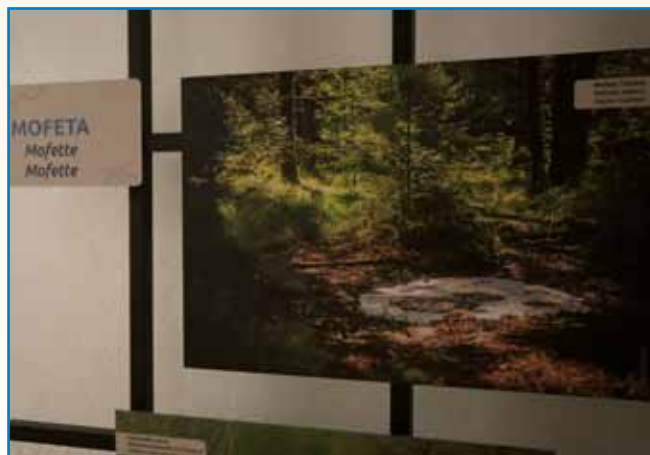
NEGOVA ODPIRA VRATA TURIZMU IZ GLOBIN NARAVE stran 8