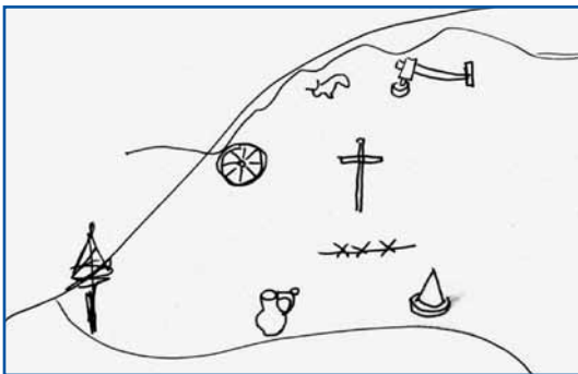
V. Slovenska ves

Varaš tö nej mogo valas dati, z misli mi oblake tazagnati.