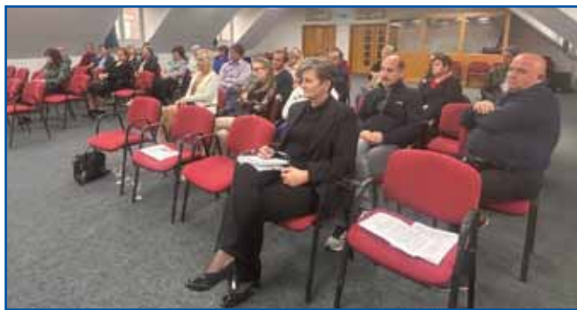
Člani na običnem zboru

ca, je skupno delo prineslo vidne rezultate na številnih področjih. Med pomembnejšimi novostmi minulega leta je omenila začetek delovanja regijske pisarne Olimpijskega komiteja Slovenije v Porabju, ki bo za mlade organizira