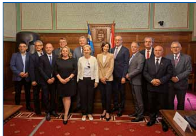
Zagovornice in zagovorniki z ministrom za družbene odnose in kulturo Zoltánom Tarrom (5. v vrsti z desne).

Na predstavitvi pred Odborom za narodnosti je Tarr napovedal spremembe dela volilne zakonodaje, ki se nanaša na narodnosti, ter okrepitev podpore narodnostnemu izobraževanju.