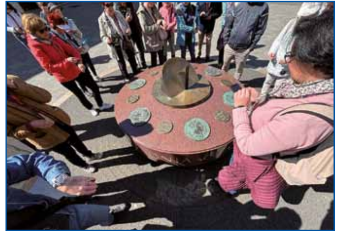
Na glavnem trgu v Sombotelu

na Dunaju (»dve krači, dve četrti janjca, tri kopune, štiri bele pogače z maslom in jajci umešanih«) ter zakaj je