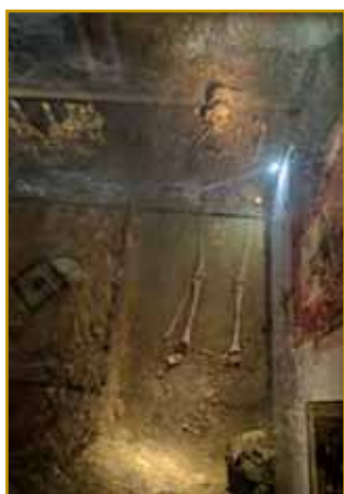
Tak eden od grobov spod glážojne vögleda.