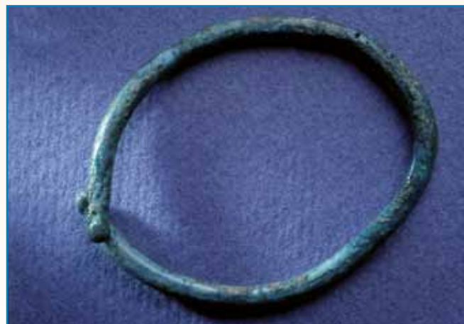
ZIDINE PRIPOVEJDAJO stran 9