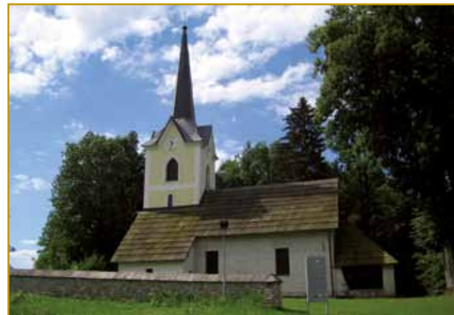
Cerkev svetoga Nikolaja že od leta 1447 na tom mestu stodji. Zaprav, dokumenti od cerkve se oprvin v tistom davnom leti »zglasijo«. Takšnoj cerkvi pravijo, ka je v koroškem tipu romanske cerkve bila napravljena.