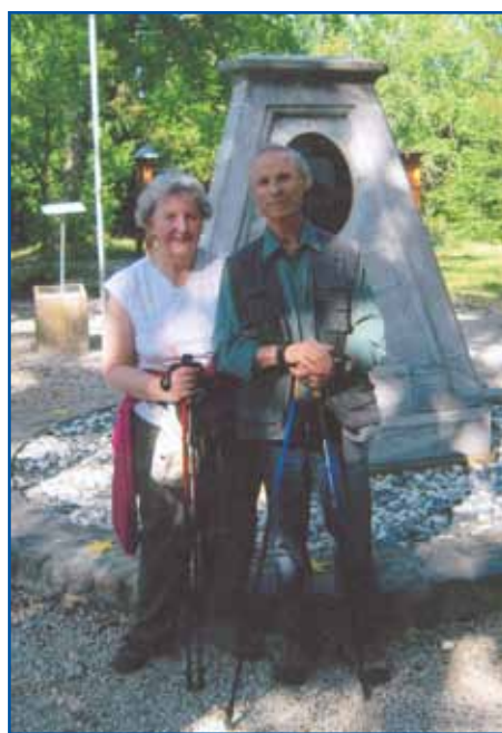
Z ženo na Tromejniku