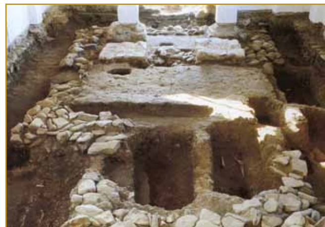
Tak so grobi stari Slavov vögledali, gda so je arheologi odkopali. Vsevküper so 26 grobov stari lidi iz Karantanije najšli. Zmejs je tüdi mlašeči grob bitu. Lidge so že po »nauvoj« pa nej po poganskoj šegi bili pokopani. Tau »nauvo« znamenüje, ka so je že po krščanskoj šegi pokopali.

nauve pa nauve grobe nut v cerkvi najšli. Nister ni pod fundamentami cerkve ležijo. Arheologi so gvüšni v tejm, ka na travniki kaulak cerkve ji leko eške več najdejo. Za tau de gda drgauh čas, ka je vöskopajo. Dugo so se spitavali, ka aj s tejm grobami včinijo. Neka trno čednoga so vönajšli. Prejk grobov so