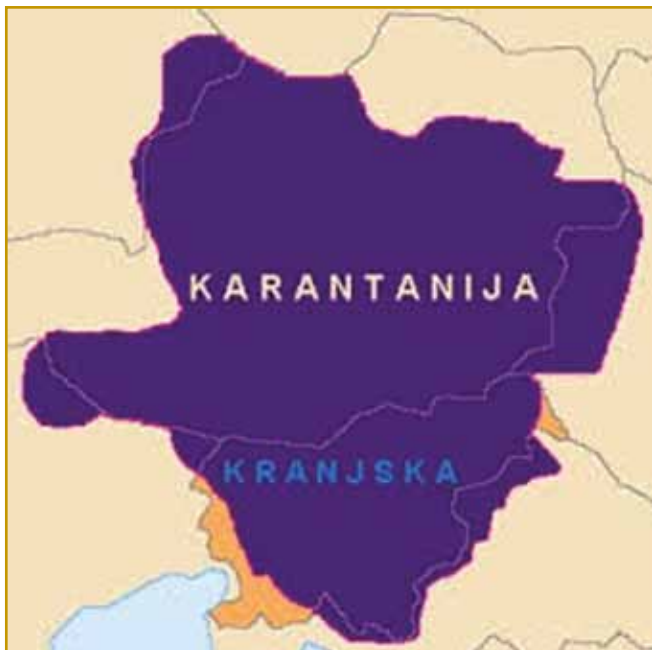
Tak je Karantanija vögledala, gda je najvejša bijla. V tistom časi so se granice leko vsikšo leto vöminile. Od Karantanije dokumenti v latinski rejči pišejo, stari Slavi so svojimi daumi Korotan prajli.

glážojne djali, tak se leko gnes prek naši stari Slavov šetamo. Skrak toga si leko samo brodim, kak je