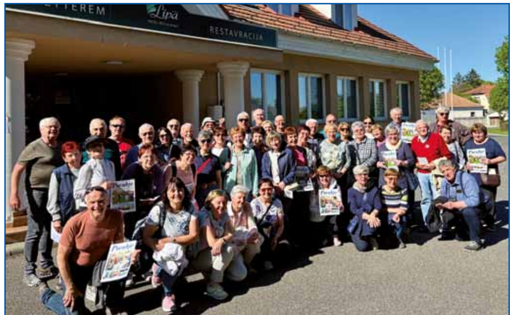
Spominska fotografija izpred hotela Lipa z zadnjimi izvodi tednika Porabje in že se vračamo proti domu s polnimi in nepozabnimi vtisi literarno-kulturniškega popotovanja od Alp do Panonske nižine.

nam v tamkajšnji dvorani predstavili film o društveni dejavnosti naših Porabcev. V poslopju je tudi uredništvo časopisa Porabje, ki je tednik Slovencev na Madžarskem ter izhaja v porabščini in knjižni slovenščini. Tu je tudi sedež Radia Monošter, ki tedensko oddaja 28 ur programa. V restavraciji hotela pa so nam postregli s kuli-