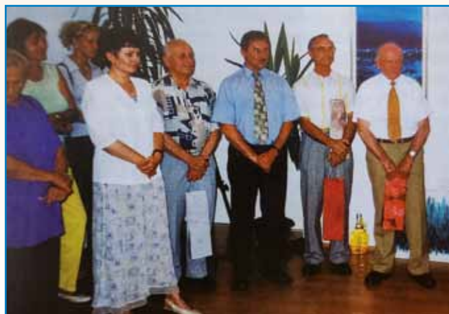
TRGOVEC, ARANŽER, GRAFIK IN TUDI UMETNIK stran 3

NA OBČNEM ZBORU ZVEZE SLOVENCEV NA MADŽARSKEM O USPEŠNEM DELU IN NOVIH PROJEKTIH