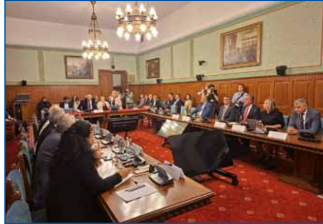
Prva seja Odbora Državnega zbora Madžarske za narodnosti

Člani odbora so pred imenovanjem zaslišali kandidata za ministra za družbene odnose in kulturo Zoltána Tarra.