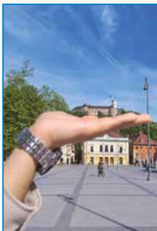
GEZIKOVNI KEDEN V LJUBLJANI stran 6