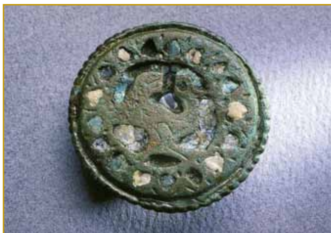
Na toj broški je pava bila napravljena, malo se gnes od nje leko vidi. Broš so nut v mlašečom grobi najšli.

rejči vöprišlo. Po enom tumačenji aj bi tau stara rejč karra ali skala bila. Nister ni pravijo, aj bi krajini ménje Kelti dali. Od nji rejč karantos prijatelj ali pajdaš znamenüje. Zvün toga