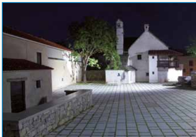
ZIDINE PRIPOVEJDAJO stran 9