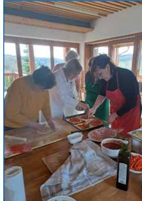
Udeleženke so pridno pripravljale brezglutenske jedi.

so potrebne tudi ustrezne razmere: kuhinjske in jedilne prostore je treba temeljito očistiti vsaj dan in pol pred pripravo, da se odstranijo vsi