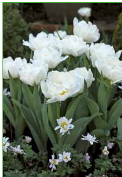
Nežnosti belih tulipanov se nikoli ne odrečemo.

ki poskrbijo, da se tulipanov nikoli ne bomo naveličali. Sorte tulipanov lahko razdelimo na tiste z enostavnimi in s polnimi cvetovi. Obe skupini pa lahko dodatno razdelimo na zgodaj in pozno cvetoče sorte. Poleg tulipanov so najbolj razširjene narcise. Legenda