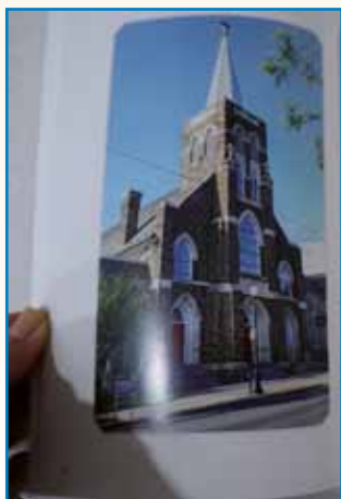
IZ PORABJA IN PREKMURJA... stran 3

Parlamentarne volitve na Madžarskem so prinesle spremembe