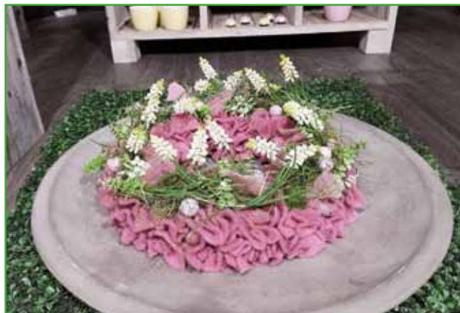
Moderna namizna dekoracija iz volne in belih hrušic

temu pa je ena sama skoraj sinonim za pomladno cvetje. To je seveda tulipan, ki je resnična zvezda pomladnega vrta. Selekcija je ustvarila neskončno raznolikost sort,