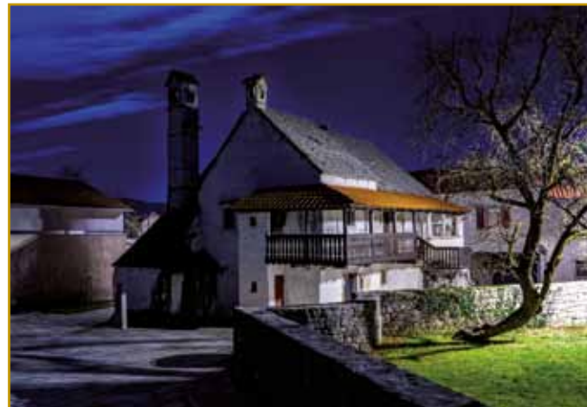
Škrateljnova domačija gnes kak Muzej slovenski filmski igralcov živé.