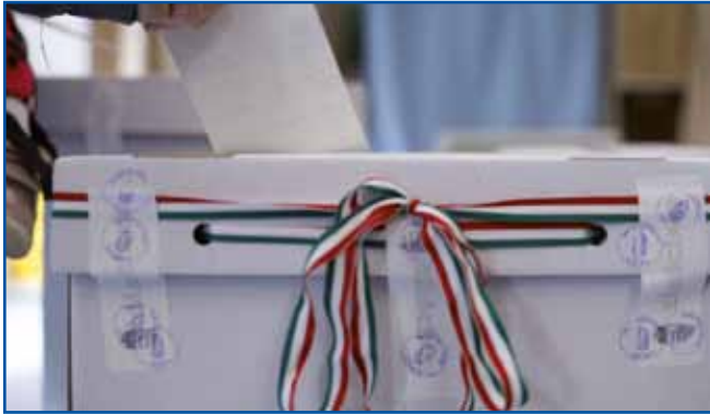
Volilna udeležba je bila na letošnjih parlamentarnih volitvah najvišja v demokratični zgodovini države (77,8).

Na parlamentarnih volitvah na Madžarskem 12. aprila je Péter Magyar premagal Viktorja Orbána. Volilna udeležba je bila rekordna – dosegla je skoraj 80 odstotkov, kar predstavlja najvišjo udeležbo v demokratični zgodovini države in presega tudi dosednji rekord iz leta 2002.