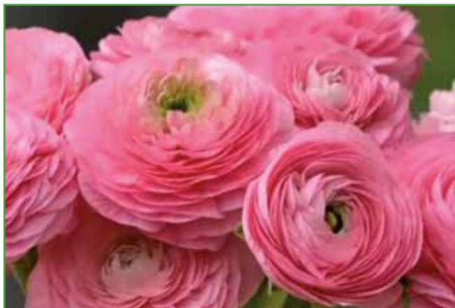
Zlatičnice so bile pravi bum letos na razstavi v Pordenonu v Italiji.

zato moramo biti pozorni na velikost čebulnice. Čebulica je v resnici zelo kratko, spremenjeno podzemno steblo z