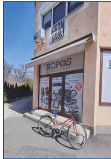
Bauta je v tistom tali Monoštra, ge je inda bila tržnica.

- Prvin so se dostakrat ža-urgali, gda so kaj naraučili k avtona, ka je nej dobro bilau, nej je pasalo.