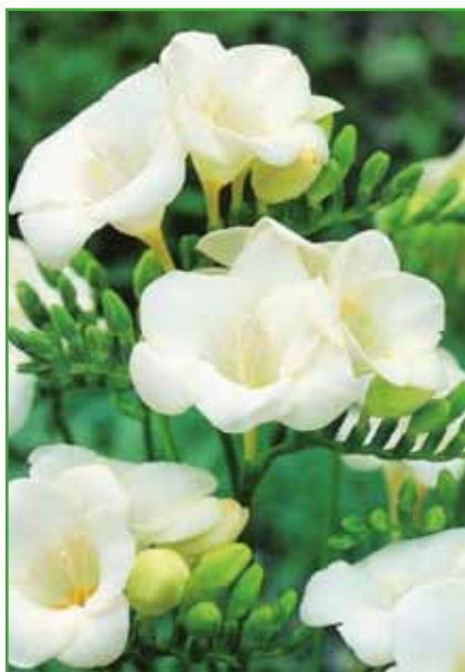
Dišeče frezije, primerne tudi za poročni šopek. Njihova vzdržljivost v vodi je dolga.