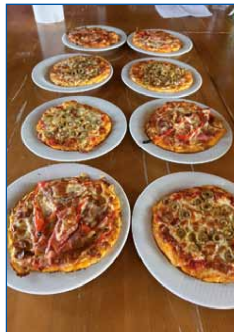
Pice, ki so bile pripravljene z ajdovo in koruzno moko.

morebitni delci glutena. Udeleženci so se najprej lotili priprave testa za pico, pri čemer so spoznali posebnosti obdelave ajdove in koruzne moke. Ti moki se obnašata