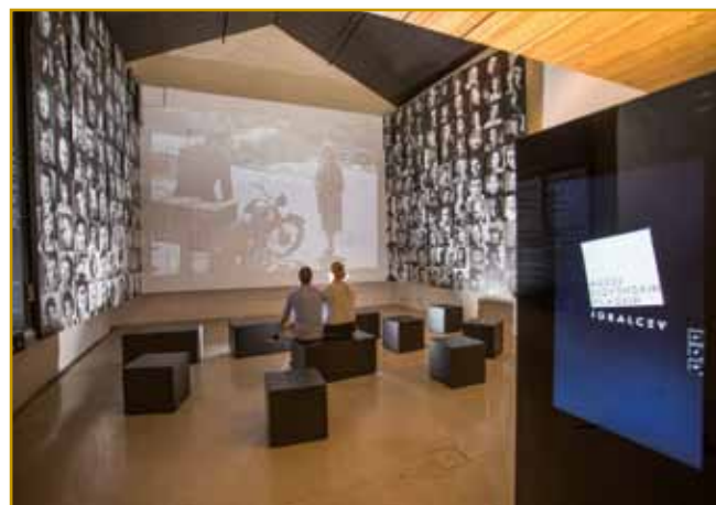
Cejlo življenje prve slovenske zvezde filma se leko pogledne, se od njega čüje tö.

Škrateljnova domačija Ta zidina gnes za najbolje stari ram na Krasi vala. Dokumenti nam pripovedajo, ka je leta 1678 Divača skur cejla dojz gorejla. Po tejm so lidge nauve rame začnili zidati. Samo eden iz tisti časov eške stodji. Občina Divača začne stari ram restavrejtrati, kak se tomi deli pravi. Zaprav, neje tau občina Divača delala, za tau pozvani lidge so velko delo obredli. Je