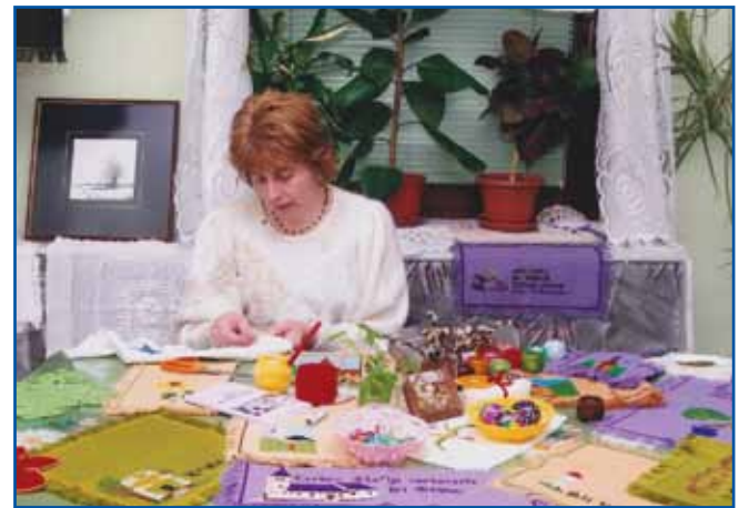
Ročna dela jo pomirjajo.

delam,« raztolmači sogovornica in cujda, ka je te pripovejst v sebi nosila od tistoga mau, ka je ostala doma. »Furt sam rada štejala knjige in sam mela veliko poštüvanje do pesnikov in pisatelov. Ovači pa se spaumnim, ka sam mela že v osnovni šauli