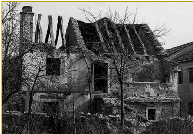
Tak je Škrateljnova domačija leta 1997 vögedala. Samo eške malo je trbelo pa bi se vküper sijnjola. Ranč leta 1997 se neka na velke vömini.

trbelo obrejditi, ka je muzej živeti začno. Za nauvo lice staroga rama je najvejšo skrb arhitekt Vojteh Ravni-