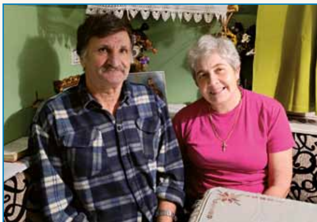
FURT JE RADA ŠTEJLA KNJIGE stran 4