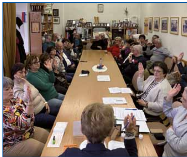
Člani društva glasujejo.