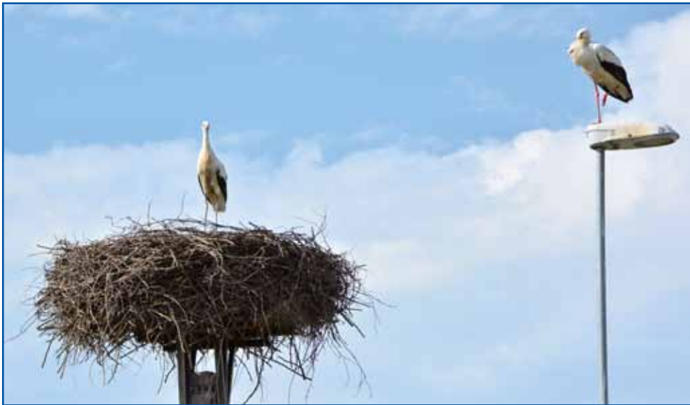
Bela štoklja na stebri

saj imajo za vrnitev še čas) nekoliko skromnejši kot v zadnjih letih, razloga za skrb po besedah naravovarstvenikov ni. Nasprotno – za njimi je izjemno lansko leto.