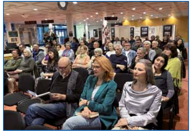
Predstavitve zbornika je bila lepo obiskana, udeležili so se je tudi številni sodelujoči avtorji.

na tem območju ali tudi za tiste, ki so se priselili pozneje? Rešitev se skriva v naslovu publikacije: vključeni so bili literati, ki v pomursko-porabskem prostoru ustvarjajo tukaj in zdaj . (Porabje z dvema narečnima pesmima zastopa pisec tega članka.) Urednica je še poudarila, da ni uporabljala »kvalita-