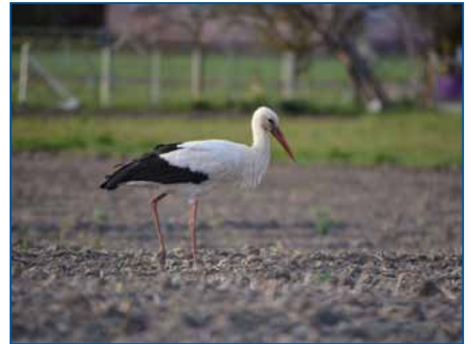
Štoklja na njivi