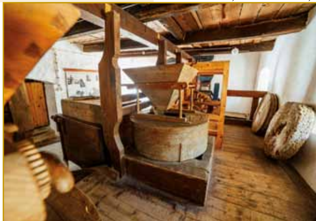
Mlin zmejs eške na kamen kaj zmele. Depa, tau zmejs za turiste napravijo, aj se vidi, kak so inda melo delali.