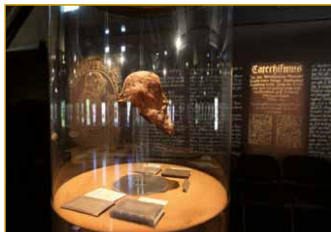
V Trubarjevi domačiji gnes muzej živé. V njem se leko vse od njegovoga dela pa živelnja zvej. Ranč tak tüdi od 26 njegovij knjig, ka ji je od leta 1550 pa do smrti 1586 napiso. Zaprav, ena je po njegovij smrti vöprišla.

domanje krajine odide. Na Nenškom živé, tam se tüdi ožene. Najbole naprej valaun pa je tau, ka