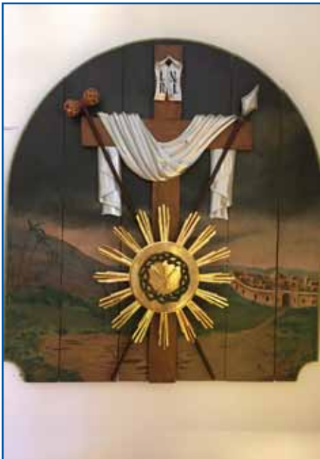
Postna oltarna tabla iz Števanovcev v Kūharovoj spominskoj iži

go. Taupli je viso na drauti in so ga mogli dvornicke naglo kaulivrat goniti tačas, ka je nej s plamenom