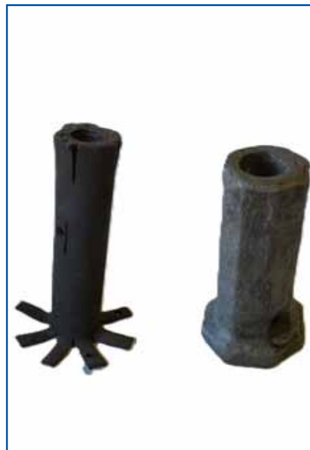
Inda so s takšimi možari streljali na veuko soboto.