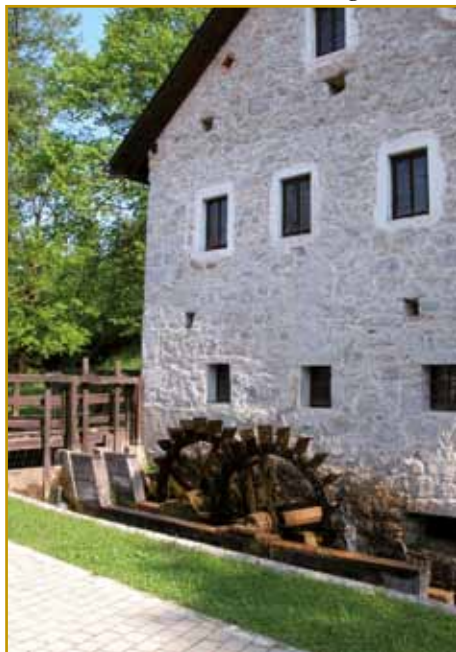
Mlin na potoki Rašica samo zmejs mela, ne dela, zidine pa so nej iz časov, gda je Trubar živo. Kaulak 200 lejt so stare, na velke pa na tiste čase prej 500 lejt nazaj spominajo.

ménje nam od toga pripovejda, ka držina je že dugi na mlini delala. Na Dolenskom mlinari eške gnesden malnar pravijo.