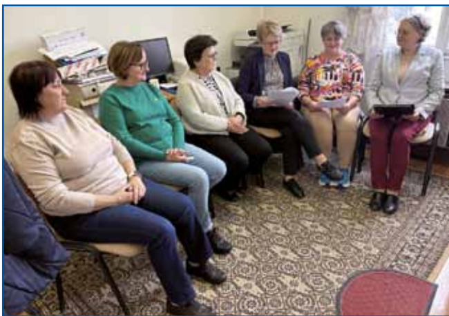
Predsedstvo je melo djilejš pred občnim zborom.

pri Gradi na Goričkom si poglednemo razstavo o stari meštrijaj in Marijino cerkev, v šteroj je na slejdnje delo v svojom žitki eričen arhitekt Jože Plečnik. Vozili mo se eške z malim cugom po lejpoj krajini. V Bogojini je predstau lejtimi Jože Plečnik začno zidati cerkev, štero je napuno s piskrenimi posaudami prekmurski ločarov. Gorpoiskemo eške rotundo v Seli, Ljutomer in Jeruzalem.