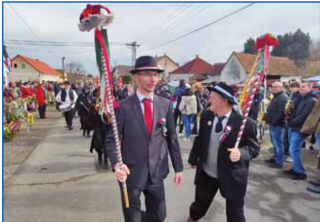
Zvača na čelu povorke

valci pa so prišli iz okolice, pa tudi iz drugih, bolj oddaljenih delov Madžarske in Slovenije. To je ena največjih prireditev v Porabju, ne le v kulturnem, tudi v turističnem smislu.«