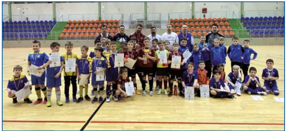
Člani najuspešnejših ekip v kategoriji U9: Jurovski Dol (1.), Paloma Šentilj (2.) in NK Križevci (3.).

sodelavcem sva videla priložnost, da bi lahko naši učenci na tem turnirju dosegli dober rezultat. Imajo močno željo po tekmovalstvu, radi bi se izkazali v tistem, v čemer so dobri.« Trenerja bogojinske ekipe občutki niso varali, saj so njegovi fantje osvojili pokal v kategoriji U11. V starosti U9 so se najbolje odrezali mladi nogometaši iz Jurovskega Dola,