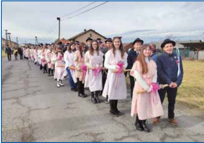
Letos je bor vleklo 31 mladih parov.

Ko v Porabju začnejo iskati bor, da bi ga požagali, to nikoli ni kar tako. Je napoved. Je obljuba. Je znak, da se bo zgodilo nekaj, kar presega vsakdanjik in poveže ljudi, porabske vasi, oba jezika in spomine.