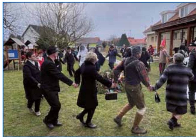
Ples okrog krošnje bora