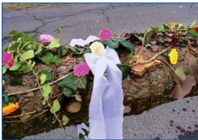
Penzionistke so brale bršljan pa z njim okinčale baur.

»Mrtveče trava kratke štingline ma, tisto moraš tak vküppobrati na en küp