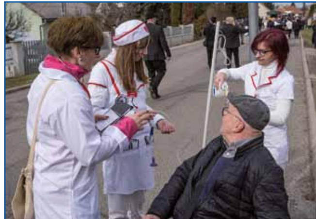
Medicinske sestre so imele veliko dela.

vlekli, jagrih, ribah, slanini, vinu in sreči, ki se je – vsaj po besedah vabovca – kar sama lepila na hišo. Vse skupaj se stopnjuje do obljube obilja in zadovoljstva, do zagotovila,