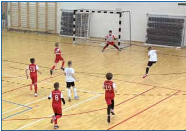
Na tokratnem turnirju sta se pomerili tudi otroški nogometni ekipi iz Ljubljane (rdeči) in Monoštra - Slovenske vesi (beli).

Turnir je bil razpisan v kategorijah U7, U9, U11 in U13 (številka označuje zgornjo mejo starosti članov ekipe), pri prvi skupini pa, žal, ni bilo dovolj prijav. Igrali so v sestavi 5 + 1, tekme so v skupinski etapi trajale 12, v finalni pa 15