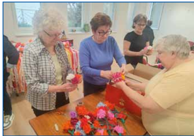
Pred borovim gostüvanjom so penzionistke trikrat mele delavnice, gde so delale papirnate rauže.

- Zdaj nazaj demo na papirnate rauže. Ka mi-