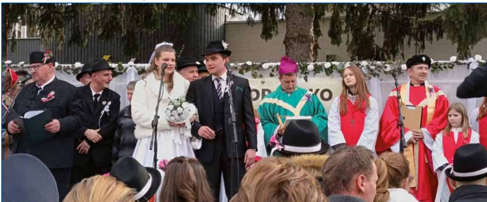
Nevesta in ženin sta prisegla pred zbrano množico v središču Monoštra.

Borovo gostüvanje namreč ni samo šega. Je dokaz, da se tradicija ohranja samo, če ljudje z njo živijo, govorijo, hodijo, vlečejo, stražijo in se ob njej