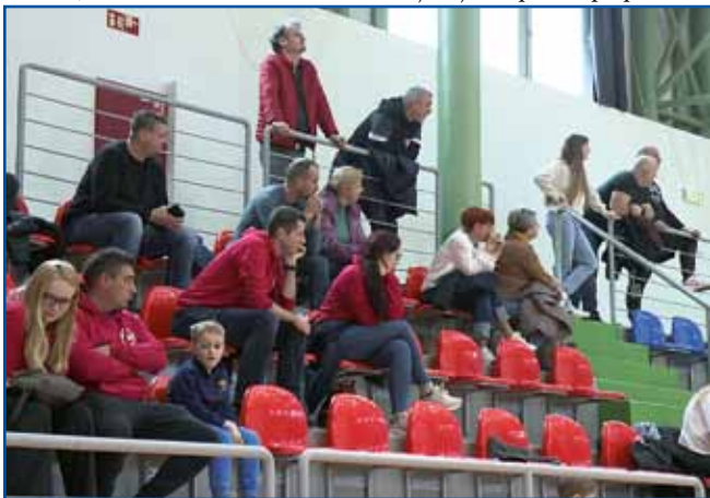
Mlade nogometaše so na monoštrski turnir pospremili tudi starši in drugi sorodniki.

minut. V Monoštru se je pomerilo največ ekip iz sosednjega Prekmurja, med njimi moštva osnovnih šol in nogometnih klubov. Slovensko Štajersko so zastopali fantje od Lenarta, iz Jurovskega Dola in Šentilja, iz Ljubljane pa so pripotovali