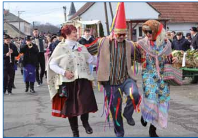
Na Borovem gostüvanju sta veselo rajala tudi Fašenek in Lenka, tradicionalna porabska pustna lika.

"Ko je borovo gostüvanje, se pokaže, da mladina je. Dva meseca se skupaj pripravljajo, vadijo, berejo besedila, se dru-