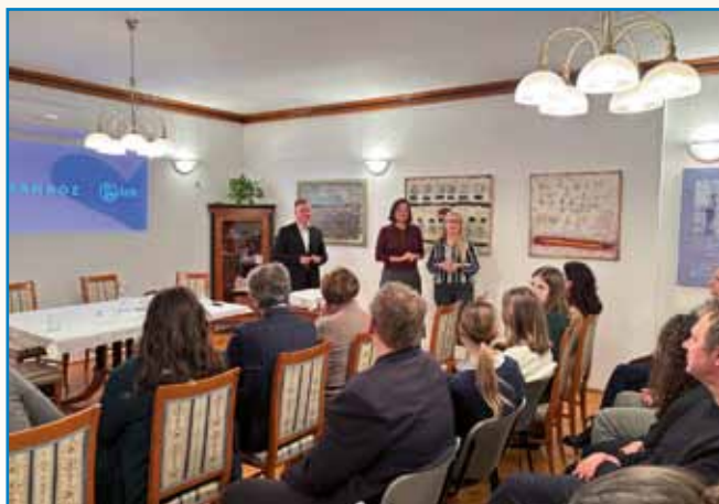
DRUŽBA LEK OZIROMA SANDOZ... stran 3