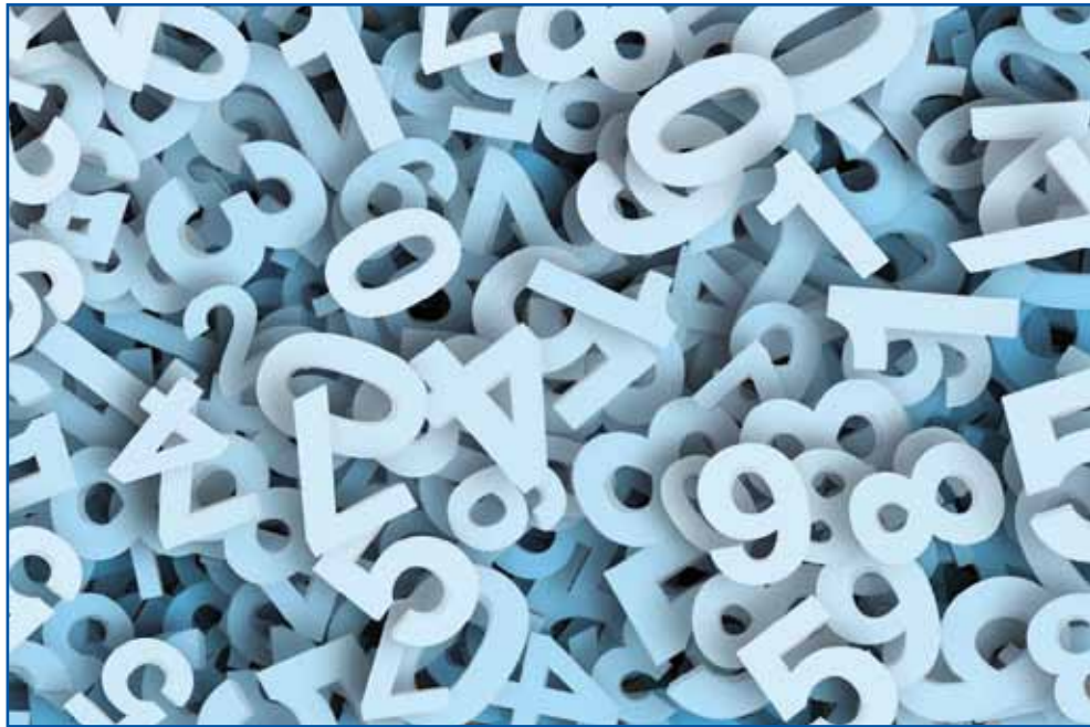
Kateri dogodki so zaznamovali Slovence in Madžare v preteklem stoletju?

Za nami pa je že leto 2025, ki je bilo še naprej zaznamovano z rusko-ukrajinskim spopadom, a tudi z novimi kriznimi žarišči po svetu. Pred nami so državnozbornske volitve v Sloveniji in na Madžarskem, ki bodo odločilno vplivale na prihodnost prebivalcev obeh držav. S skromnim upanjem si lahko le želimo, da bi bilo prihodnjih sto let nekoliko mirnejših, kot je bilo tistih sto za nami.