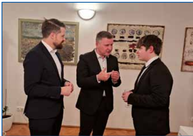
Dijak monoštrske gimnazije pridobiva informacije o možnostih štipendiranja in dela pri družbi Lek oz. Sandoz.

vsem svetu. Njihovo poslanstvo je jasno: premikati meje dostopnosti zdravljenja in s cenovno dostopnejšimi zdravili prispevati k vzdržnosti