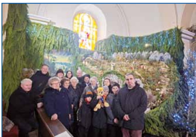
Pred betlehemom v cerkvi v vesnici Vörs.

Lejpi in veseli den smo meli, kakoli, ka je mrzlo bilau, dapa zatok se leko vzimi tü posreči eden dober izlet.