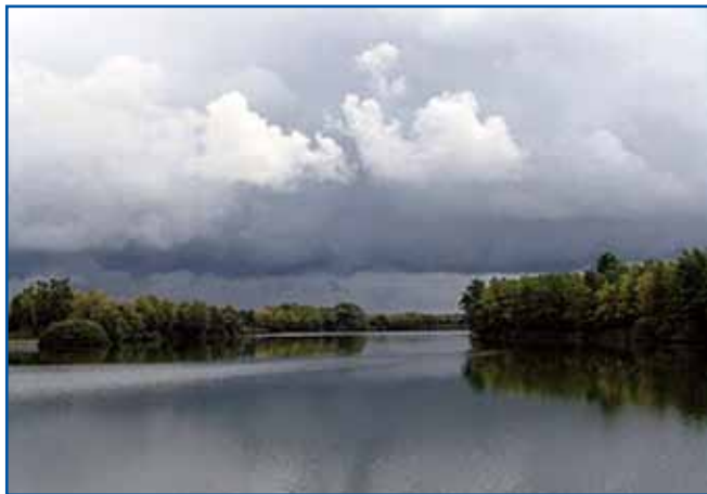
Pejsaž panorame Panonije

Omenjeni koncert je stanovsko Društvo slovenskih skladateljev organiziralo v okviru svoje redne abonmajske ponudbe. Ker pa je DSS ob koncu lanskega leta praznovalo 80-letni-