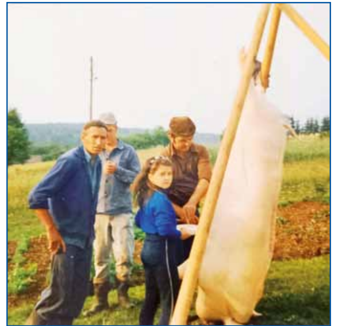
Pujcek na šragli. Bila so lejta, ka je v eni sezoni več kak 50-krat zabado.

»Kak sem začno zabadati, najprvin so me sausedje zvali, te drudji iz vesi, nej na dudje pa že iz sausedne