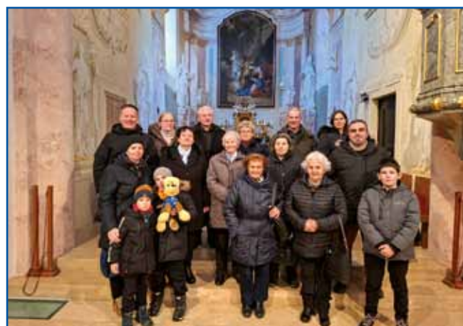
Pred baročnim oltarom v Vörsi.

lehem (jaslice). Vejmo, ka betlehem samo v adventnom