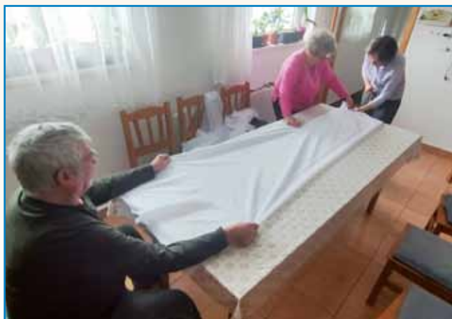
MALO BABO ŠLATAM stran 8