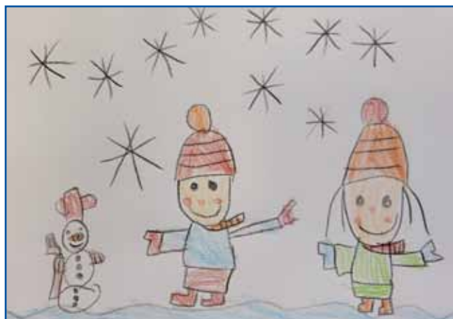
Luca Mesics, 6 let, skupina Zvezdice