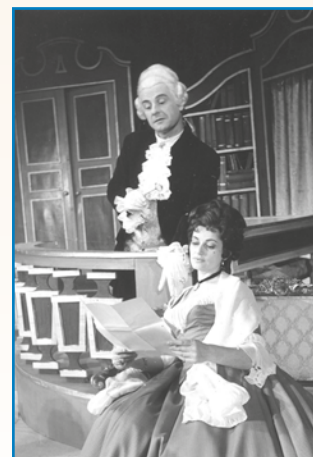
PRIPOVEJSTI O MENJE POZNANI ŽENSKAJ stran 9