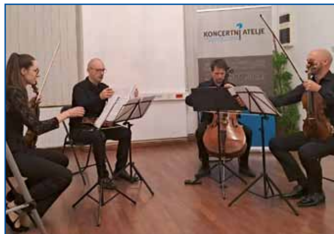
Godalni kvartet kolektiva Carpe artem na ljubljanskem glasbenem odru, 12. november 2025

polni rečnih (Mura, Drava, Donava in Tisa) glasbenih in likovnih slikanj. Vanje se vpletajo še citati ali v ozadju zvoneče ljudske pesmi panonske ravnice Zašlo je lepo sunce ..., Tkalečka, Marko skače, Medžimurje kako si lepo zeleno, Šorka je Tisa in Baba ide na gostijo. To je res (godalni) kvartet za navadnega človeka. V Murski Soboti rojeni slovenski skladatelj je vse-