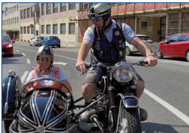
Vnük jo je za 90. rojstni den z motorom pelo po soboški vilicaj.