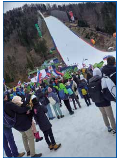
Za slovenske orle je navijalo 600 zamejskih otrok.

ne izkušnje. Razpoloženje je bilo izjemno prijetno, saj so se mladi srečali z vrstniki, ki se prav tako kot oni učijo slovenščino kot drugi jezik. To je bila odlična priložnost