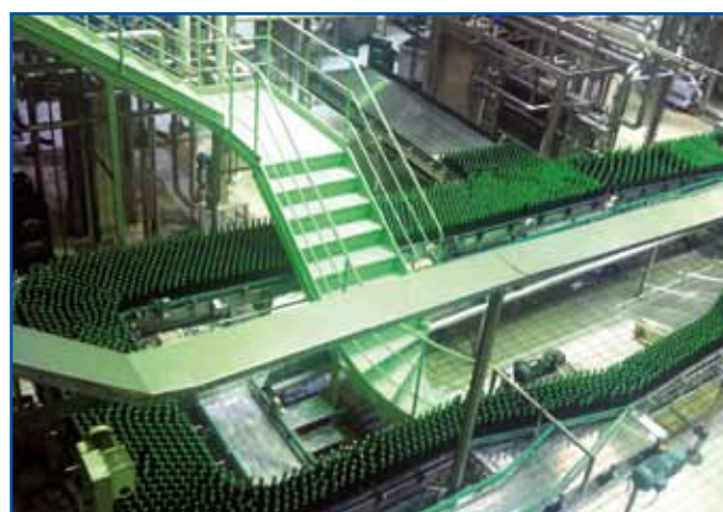
Gnesnedén mašinge sploj brž punijo zelene glaže.

Apriliša 2015 je več kak polonje laške fabrike dojküpo holandski pivovarski orijaš Heineken. Edno leto kisnej sta se ljubljanska Pivovarna Union pa Pivovarna Laško združili in cejlak prišli v rokau Holandcov. V 2021. leti so se prejdnji odlaučili, ka