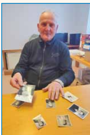
SAMO SPAT PA DJEJST ODIM DOMAU stran 8