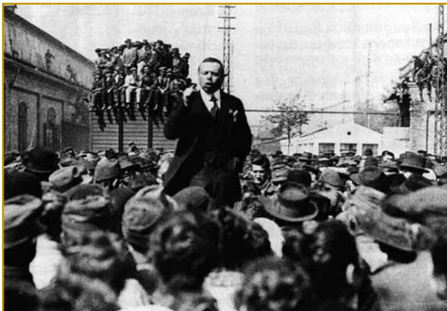
Béla Kun je dober pajdaš z Leninom biu. Ranč un njemi je kak mentor dojdavo, kak aj rdečo revolucijo tadale pela.

Trbej prajti, ka lidge so najprva velko vüpanje v tau nauvo politiko meli. Najbole srmački lidge, ka so na zemli delali. Mali