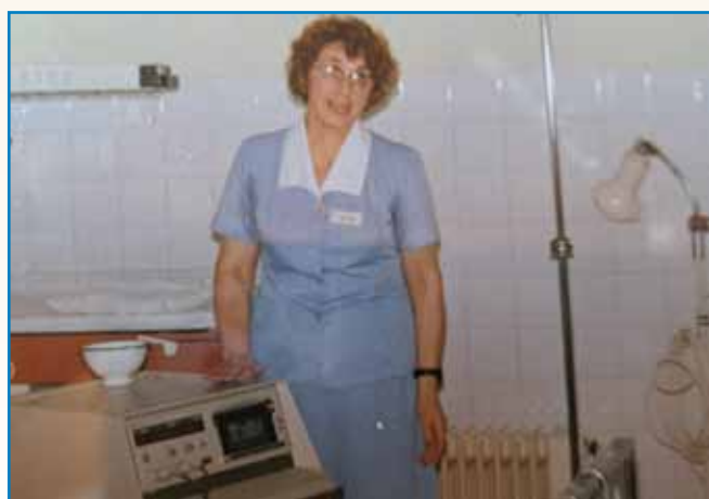
DESET VŮR SE JE S CUGOM PELALA OD LJUBLJANE DO SOBOTE stran 3