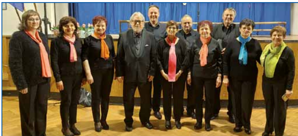
Člani Komornega pevskega zbora iz Monoštra pred nastopom v dvorani v Vipavi.