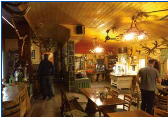
Jelenova oštarija znoutra

Beznoovci so ravenska ves pod Goričkom, nej da-leč od Austrije. S tej vesi je bila pokojna Marija Ritu-per, štera je inda vodila folklorno skupino v Sa-kalauvcaj. Največ Bezno-