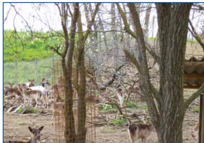
Beznouski damjaki

križali svoje evropske koze s kozami črnkij no-madov, tak je gratala ta fajta. Burske koze so bole za mesou, nej za mlejko. Zvekšoga so bejle té koze z ridjavov glavouv pa du-gimi ridjavimi vüjami. Majo ešče romanovske ovce, štero so zredili v 18. stoletji na Rusuškem, na zgornjom kraji reke Vol-ge. Ta stvar je črnkasta,