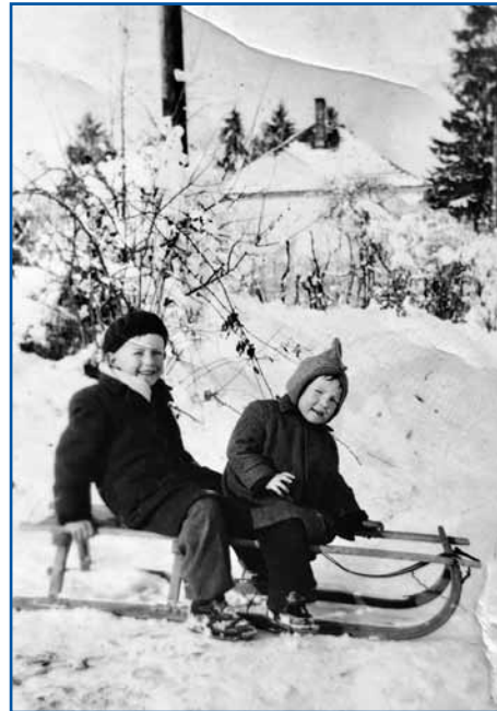
Gda je mali biu, je še bilau dosta snega. Na sanaj za njim sedi njegli brat, steri je trno rano mrau.

vine talati v Varaši, zdaj že petnajset lejt. Dja tau fejt rad delam, zato ka dja sem taši, steri vsigdar nika moram delati, vsigdar moram titi, vsigdar sem na pauti.