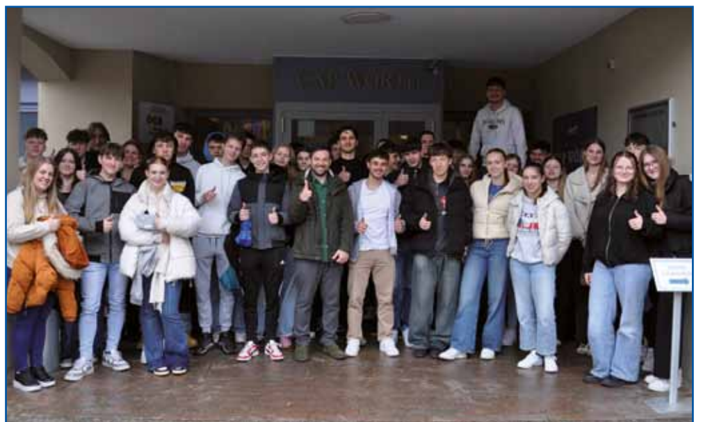
Udeleženci srečanja Mreže Alpe-Jadran

tihi. Hrana je bila odlična, organizacija dogodka brezhibna, razpoloženje pa izjemno pozitivno. Vse skupaj je bilo nepozabno doživetje,