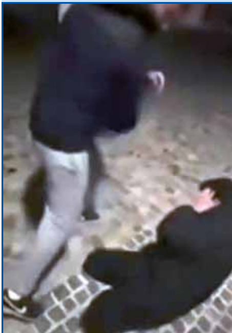
Tak je za istino vögledalo, kak je pojep klečo, drugi kaulak njega pa so ga bili.

... se je v medijaj vse vöminilo, kak se je šport na snejgi zgotovo. Eške eden teden nazaj je vse puno od toga pisalo, ka so slovenski športniki dosegnoti. Po tejm so svoje mesto druge informacije daubile.