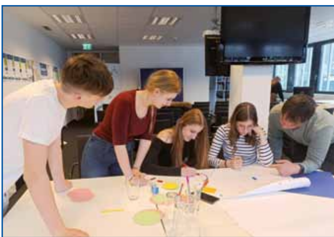
Mladi so se poglobljeno ukvarjali s temami umetne inteligence (UI) in digitalizacije, razpravljali o perspektivah prihodnosti ter navezovali stike.

zelo veliko peli, pa tudi zato, ker nas je čakal nepozaben dan. Ko smo prispeli, nas je