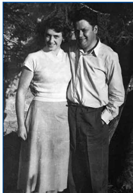
Cica in njeni Jeni

šeča lejta so bila rejsan lepa, čiglij sam gorrasla v cajti drüge svetovne bojne. Znamo, ka je bila Ljubljana obkraužena z droutom. Mi smo meli en velki travnik, prejk steroga je té draut biu potegnjeni. Moški so se s kosilnico mogli daleč okauli pelati, ges pa sam se večkrat potegnola spodkar pod droutom. Talijanski sodaki so se nej preveč čemerili. Eden mi je celau grable pomago prejk drota djasti.«