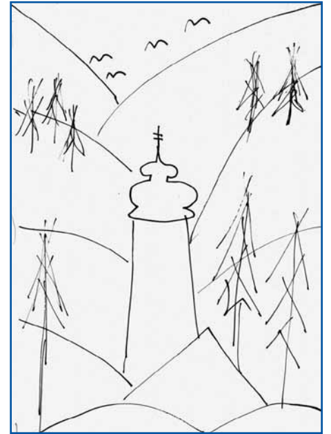
(ilustracija Marija Kozar)

Nekoč oči tema mi bo prekrila, Luč sonca več ne bo sijala vanje. Takrat se moja pesem bo sklenila: Porabje, lahko noč in mirne sanje.