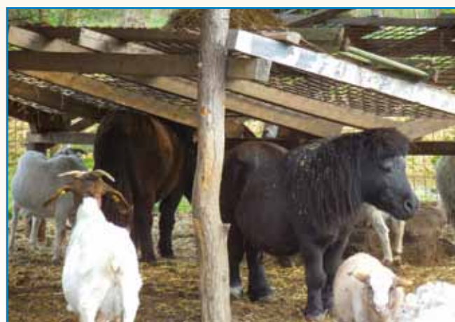
SRCE BEZNOUVEC stran 10