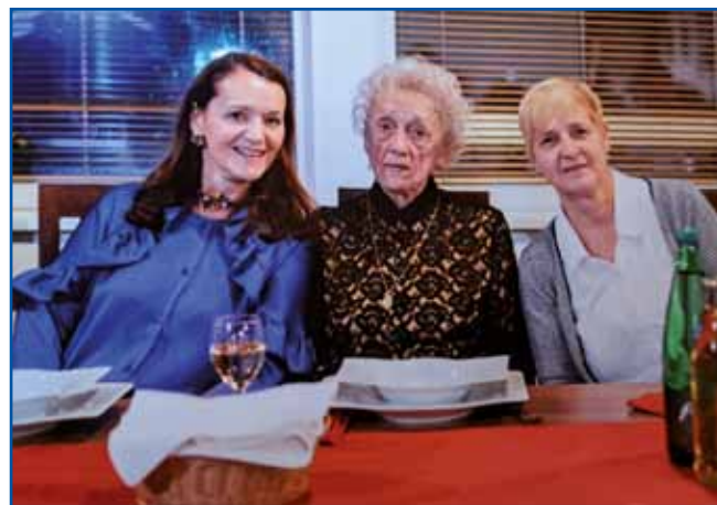
Sogovornica z obema čerkama

Hano, Valesko in Eleno.« Sogovornico, stera rada šte knjige in rešavle križanke, na televiziji pa rada pogledne tüdi kakši film, sploy kriminalke ma rada, je vnük za njeni 90. rojstni den razveselo z vožnjo z motorom po Soboti. Namreč,