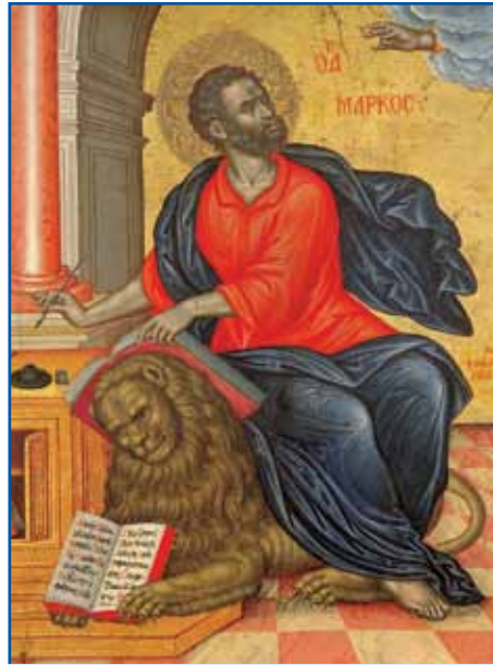
Evangelist sveti Mark

cesiji se začne vüzemsko veselje. Po Porabji kürijo velke ognje (kresove), streljajo s štüki pa karbidóm. Ogenj je gé simbol rojstva Jezusa Kristuša, vüpanja in svetlobe.