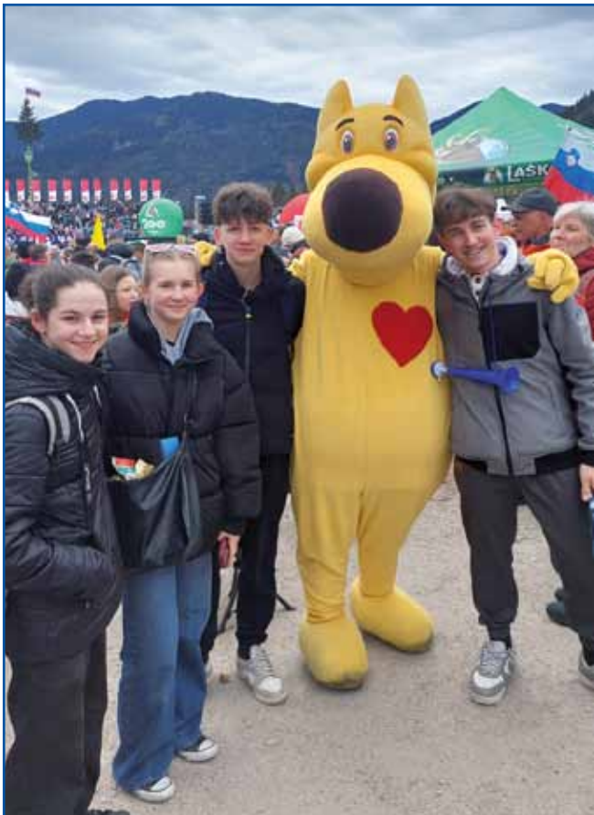
Porabski mladi z maskoto v Planici

prvenstva v smučarskih skokih v čudoviti Planici. Razpoloženje je bilo odlično že med vožnjo, ker smo