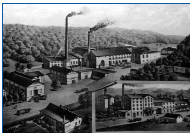
Pivovarna Laško na razglednici iz druge polovice 19. stoletja

»Podnevi in ponoči, le piva si natoči,« spejva skupina Šank rock iz Velenja v svojem priljubljenom šlageri Laški pir. Ne čudivajmo se toma, vej pa večina Slovincov, če želej v letnoj ici nika ladnoga