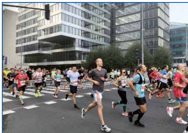
Prvih nekaj kilometrov so udeleženci 28. Ljubljanskega maratona tekli proti severu po Slovenski in Dunajski cesti. Letos je bilo na športni dogodek v treh kategorijah prijavljenih 15.267 tekačev iz 86 držav.

»Moj doseženi rezultat je kar dober, postal sem 4. med tekači z Madžarske. Okoli tretjega ali četrtega kilometra sem moral nekaj časa