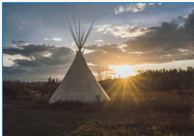
PRIPOVEJSTI O SLOVENSKI KRAJINAJ stran 9