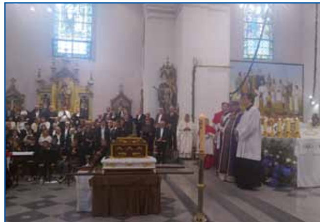
Kleklinov »sprejvod« (pokapanje)

V soboto, 12. oktobra, po svetöj meši v sobočkoj cerkvi je Garda slovenske vojske odpelala čönte v Čerensovce. Drügi den, 13. oktobra so po