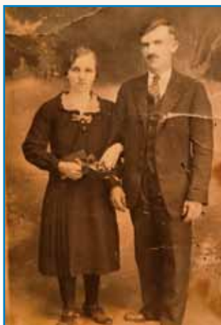
DOSTA SEM TRPELA stran 8