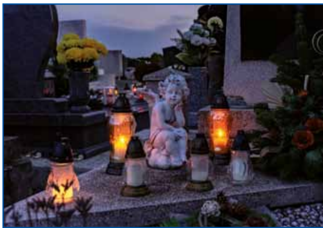
Luč preganja temo in smrt, luč pomeni, da je spomin na vse naše drage še živ.

Praznik vseh svetih – uradni naziv v Sloveniji je dan spomina na mrtve – se osredotoča na pokopališča, zato se morda zdi mračno, vendar je smrt bistveni del življenja in 1. november to dejstvo poudarja.