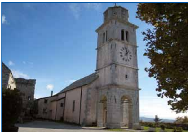
Repentabor, ena najlepših vedut na tržaškem Krasu, kjer poteka Kraška ohcet, največja etnološka prireditvev Slovencev v Italiji.

kast, bi kmalu ugotovili, da je potrebno biti zamejsko (oziroma italijansko predmejsko) "izobražen", da razumemo smisel njihovih besed. Izposojenk iz italijanske s slovenskimi končnicami je namreč v povedih ničkoliko in vprašanje je, če