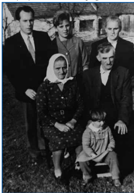
Z možaum, materjov, babov pa dejdekom (sedita), steriva sta njau gorazranila.

»Nikan smo nej odli, zato ka s tauga je vsigdar samo bojna bila pa bitje, niške nej smo z menoj plesati, niške nej smo name pogledniti.«