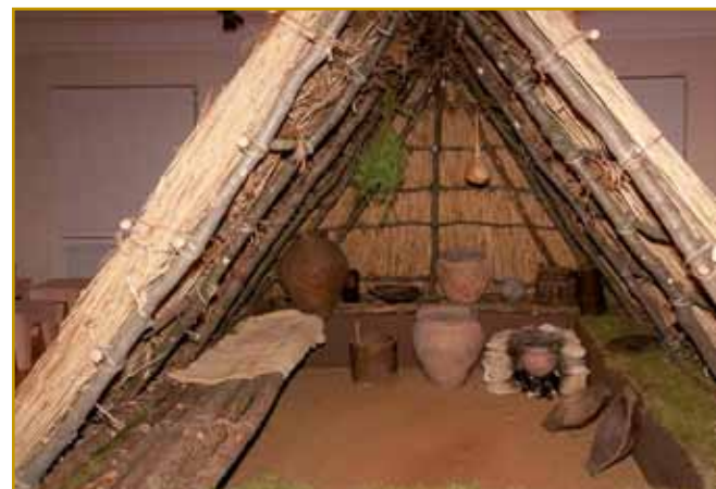
V takši ramaj so inda stari Slavi živeli. Živeli po tejm, gda so se na enom mesti stavili, si tam svoj daum najšli. Prva so, kak zvekšoga vsa druga lüstva tistoga časa, nomadi bili. Iz ene krajine v drugo so se selili. Ranč rejč hram nam od tisti časov pripovejda.

časi ostanola. Vsi, steri guči-mo, tak znani nejmi »h« po-znamo. Zatoga volo mi (h)ram pravimo. Tisti stari ram je vcejlak ovak vögledo, kak so tisti prvi kaulak gnešnje