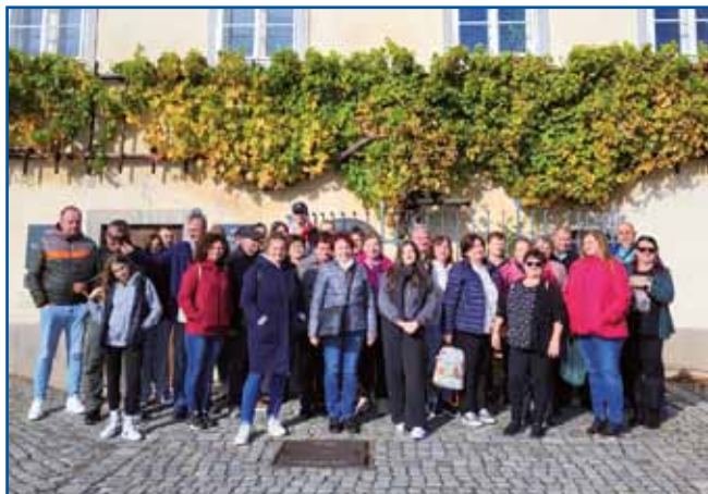
Tri narodnosti, Madžari, Nemci in Slovenci z Dolnjega Senika na izletu v Mariboru

nimi napisi, ki smo si jih prebirali med sprehodom proti vrhu stolpa. V Mariboru smo si med drugimi ogledali 400 let staro vinsko trto, ki velja za najstarejšo na svetu. Z vzpenjačo smo se