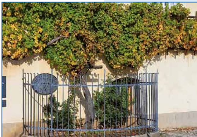
Žametna črnina, ki raste in rodi že več kot 400 let, je vpisana v Guinnessovo knjigo svetovnih rekordov kot najstarejša žlahna vinska trta na svetu.

pot med krošnjami smrek opremljena z informativ-