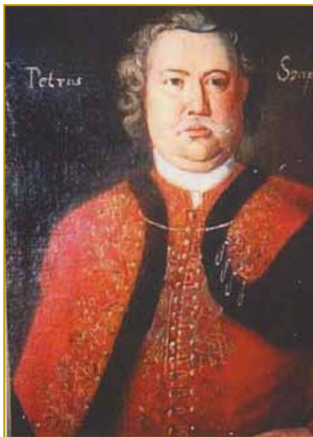
Széchyji ali po domanje Sečiji so v krajini do leta 1687 »vertivali«. Leta 1687 Peter Szapáry za 35 gezero forintov dober »biznis« naredi. Za te pejmeze grad pa varaš z cejlím verstvom dobi, kcuj eške velko ves Martjance pa eške 39 menjši vesi ranč tak.

pridemo. Zavolo dvorca Belmur je pomalek cejla krajina po njem ménje dobila. Krajini skrak lejevoga brga reke Mure se je distrikt Belmur prajlo. Ta rejč distrikt gvüšno nika z našimi starimi Slavi nema. Ta latinska rejč je po tejm naprej prišla. Ka se je z velikim ramom Belmuro zgodilo, ne vejmo. Leko, ka na njegovom mesti gnes sobočki grad stodji. Vej se pa, od gda tadale leko od Sobote pripovejdamo. Leta 1235 se oprvin od dvorca Belmur leko kaj taprešte. 1263 že od distrikta Belmur tö, ka bi se leta 1348 že za Soboto vedlo. Krajina je že pod Vaugre spadnola, so si jo za svojo vzeli. Zatoga volo je Sobota v dokumenti iz tistoga leta kak Murazombatha nut napisana. Ja, glavaške so v svojoj rejči pisali, domanji lidge pa tada-