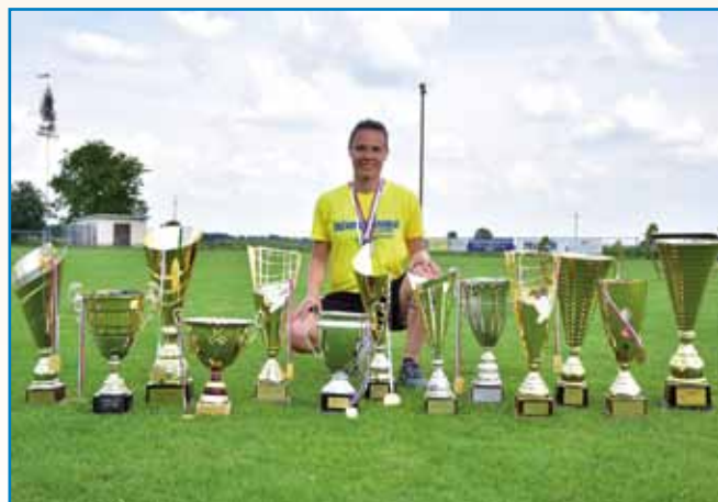
FOTBAL JE VŌODABRAU NJAU, NEJ ONA NJEGA stran 6

SLAVIMO SVETNIKE, KI SO DOSEGLI KONČNI CILJ