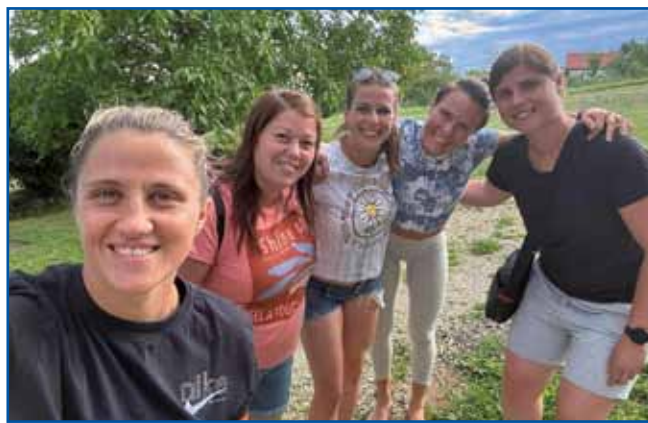
Tjaša se rada družü z nekdešnjimi fotbalerkami iz ŽNK Pomurje.

gda sam bila v petom razredi.« Leta 1999 je biu v Odrancaj na noge postavljeni ženski fotbalski klub, steri se je te preselo v Filovce, sledkar pa v Böltince. V té klub, steri se je te duga lejta zvau ŽNK Pomurje in je dosego rejsan lejpe rezutate, se je te vključila naša sogovornica tö.