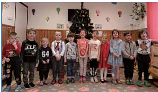
Zbrani ob lepo okrašenem božičnem drevescu. Praznujemo božič v vrtcu Števanovci

dogodkov, ki se jih naši otroci najraje spominjajo in zato smo se v obeh vrtcih še posebej potrudili, da bi jim z obiskom dobrega moža pričarali nepozabne trenutke. V vrtcu Gornji Senik so prijetno zadišali tudi okusni piškotki, ki smo jih spekli kot del naše priprave na bližajoči se božič. Otroci so veselo z modelčki izrezovali različne oblike medenega peciva. Ob vstopu v vrtec je otroke presenetilo lepo okrašeno božično drevesce. Pod božičnim drevescem so jih čakala darila, ki so jih z velikim zanimanjem odpirali. Prav tako smo v obeh vrtcih izdelovali voščilnice, darila in razne drobne pozornosti za vse tiste, ki so se udeležili našega božičnega bazarja ter ob tem prepevali božične pesmi. Prisluhnilo smo še čudovitim božičnim pesmim in pravljicam iz knjige ter pred prihajajočimi prazniki drug drugemu zaželeli vesel božič in srečno novo leto 2023.