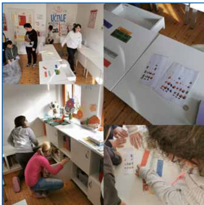
Soba pobega pri uri slovenščine

Pri uri slovenščine smo prebrali besedilo o Francetu Prešernu. Naslednjo uro smo imeli sobo pobega. V sobi pobega smo iskali listke, ključe, uganke, knjige, slike in škatlo. Naloge so bile povezane z največjim slovenskim pesnikom. Všeč nam je bilo vse, kar smo pri uri delali.