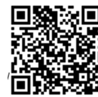
EU v moji šoli, DOŠ Števanovci