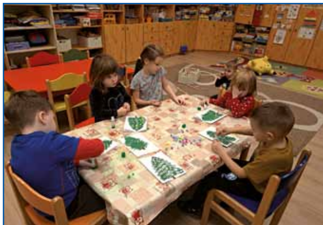
Izdelujemo božično-novoletne voščilnice. Vrtec Gornji Senik

V prazničnem mesecu decembru smo v obeh porabskih vrtcih Gornji Senik in Števanovci