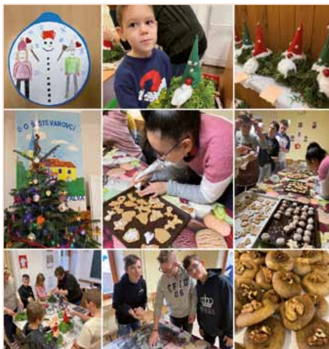
Pekli in okraševali smo medenjake