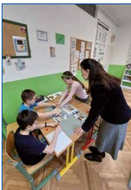
Zimski praznik je tudi Prešernov dan. Peli smo slovensko himno, risali pesnikov portret in izdelali plakat o Francetu Prešernu. Osnovna šola Janoša Aranya