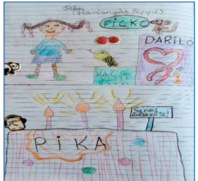
Predstava nam je bila zelo všeč. Učenci OŠ Jánosa Aranya