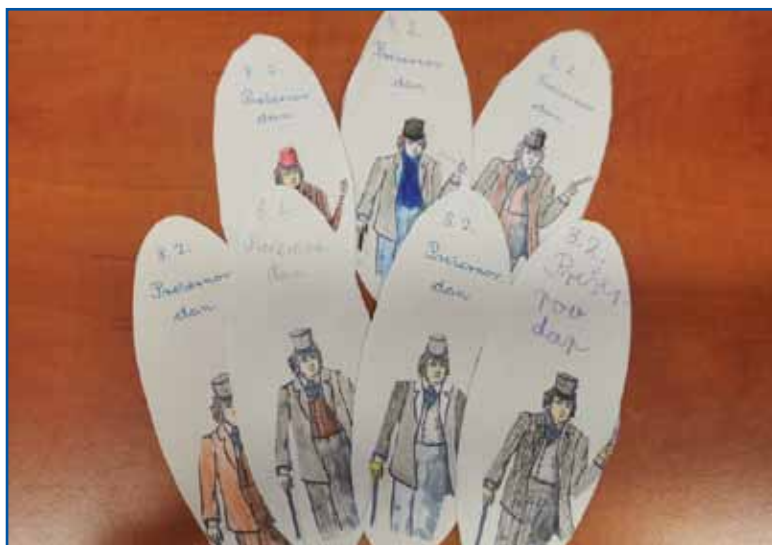
Izdelki učencev 1. razreda DOŠ Jožefa Košiča