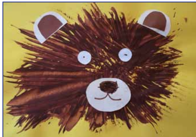
Kolos Ficško, 6 let, vrtec Sakalovci

Poskrbeli smo za naše lačne ptičke. Na igrišče smo postavili ptičjo krmilnico in nasuli