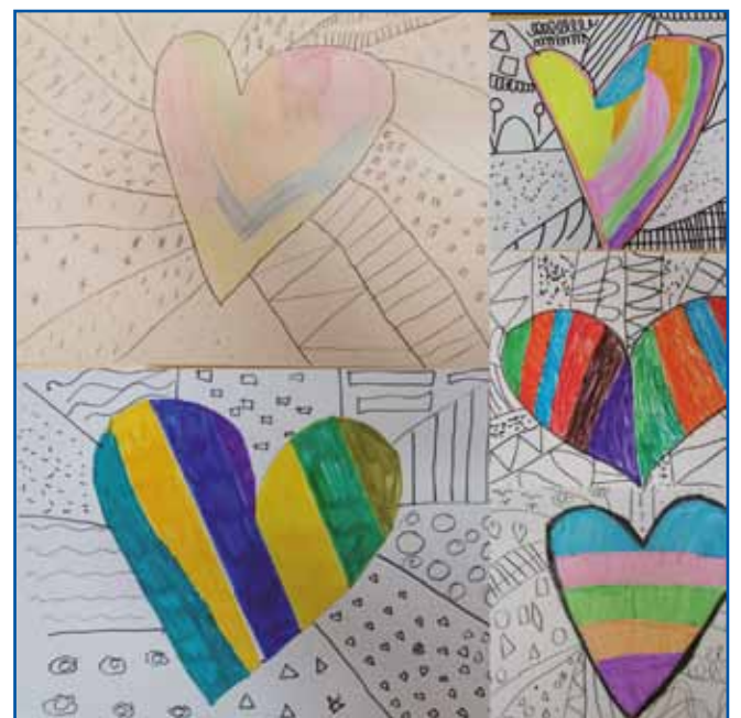
Valentinovo 3. in 4. razred DOŠ Jožefa Košiča