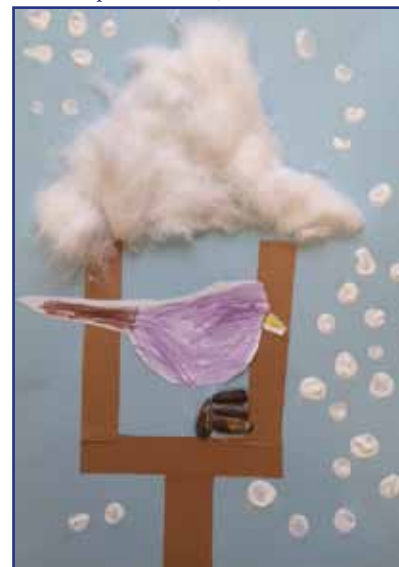
Ptičja hišica, ustvarjali otroci iz vrtca Monošter

se različne gibalne igre, opo- našali gibanje živali, se igrali pantomimo, naučili smo se