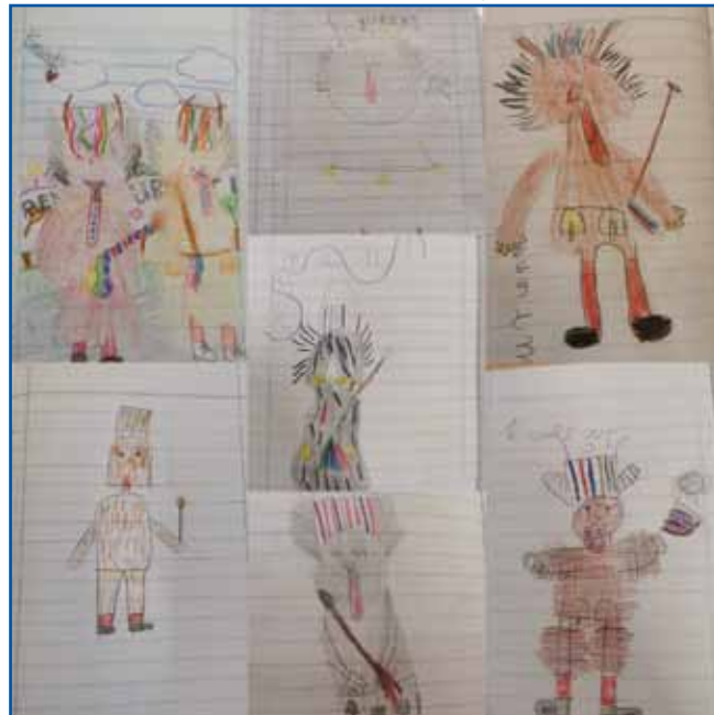
Kurenti, izdelki učencev 4. razred