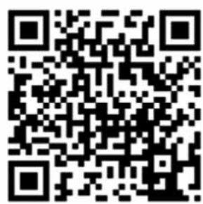
Rogla 2023, Zimski utrinki