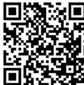
Rogla 2023, Noro smučanje