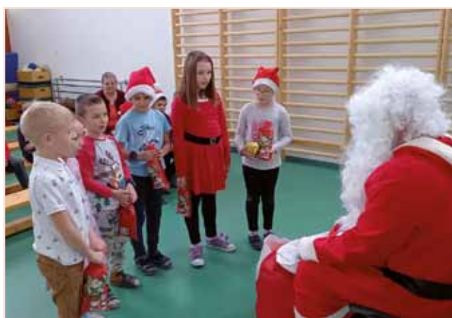
6. decembra nas je obiskal sv. Miklavž. Prinesel nam je mnogo sladkarij. Mi smo mu zapeli in recitirali slovenske in madžarske pesmice.